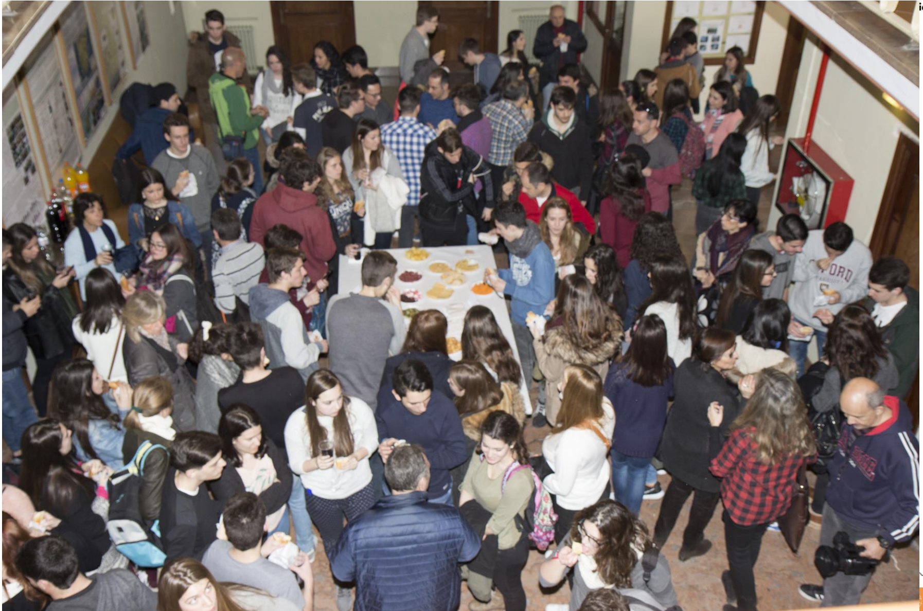
Almuerzo y convivencia olímpica en Zaragoza