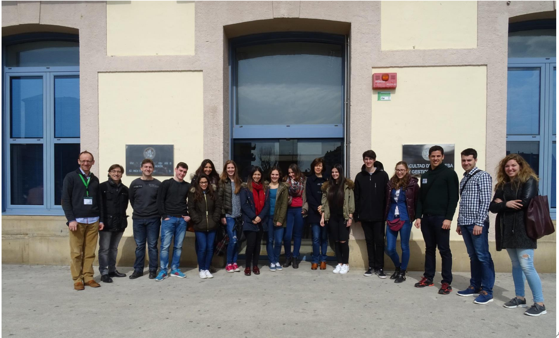
Todos los olímpicos geográficos en Huesca